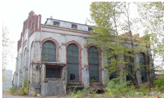
fol. 58 Budynek łaźni "Gwarek" (7) - elewacja wschodnia