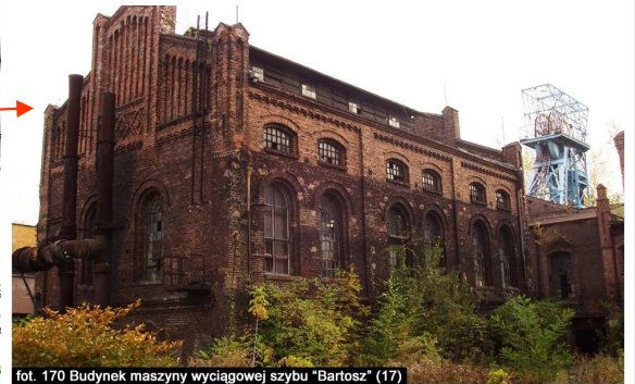
fol. 170 Budynek maszyny wyciągowej szybu "Bartosz" (17)