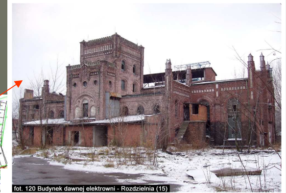
fol. 120 Budynek dawnej elektrowni - Rozdzielnia (15)