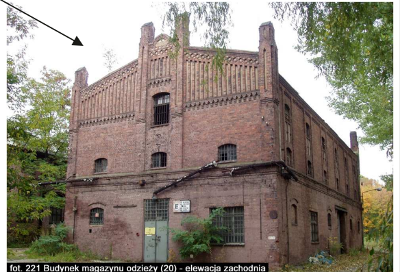
fol. 221 Budynek magazynu odzieży (20) - elewacja zachodnia