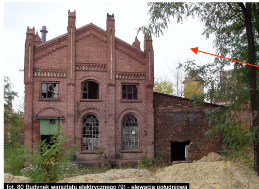
fol. 80 Budynek warsztatu elektrycznego (9) - elewacja południowa